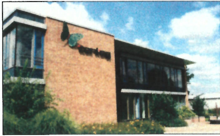
Das CONTAG Gebäude am Pāwesiner Weg 30

Zu den Vorzeigeunternehmen des Bezirks gehört ohne Zweifel der Leiterplatten-Spezialist CONTAG mit seinem Firmensitz am Pāwesiner Weg. CONTAG bietet seit nahezu 40 Jahren passende High-Tech-Leiterplatten für die Elektronikindustrie in hoher Qualität und mit großer Schnelligkeit an. Der mehrfach ausgezeichnete Leiterplattenservice wird in der Branche sehr geschätzt und macht das Unternehmen zu den schnellsten Herstellern von Leiterplatten-Prototypen und damit zu einem Marktführer in Europa. Mit diesem sogenannten „Leiterplatten-Express“ kann CONTAG Leiterplatten bereits innerhalb von 4 Stunden herstellen. Die Standardlieferzeit beträgt 3 Arbeitstage.